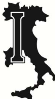
ANNIVERSARY-SW 41 x 75 cm - 1,5 Kg