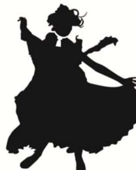
FRIVOLOUS 60 x 75 cm - 2,8 Kg